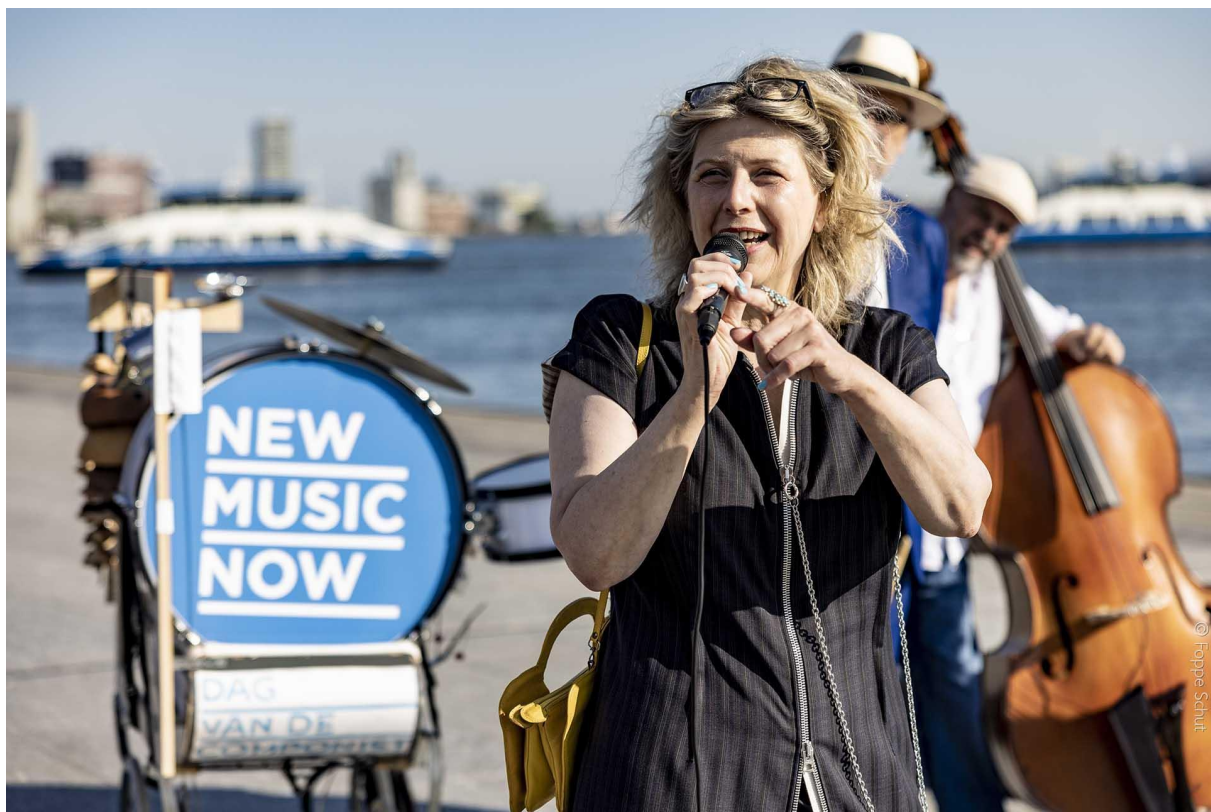
Opening Dag van de Componist door Esther Gottschalk