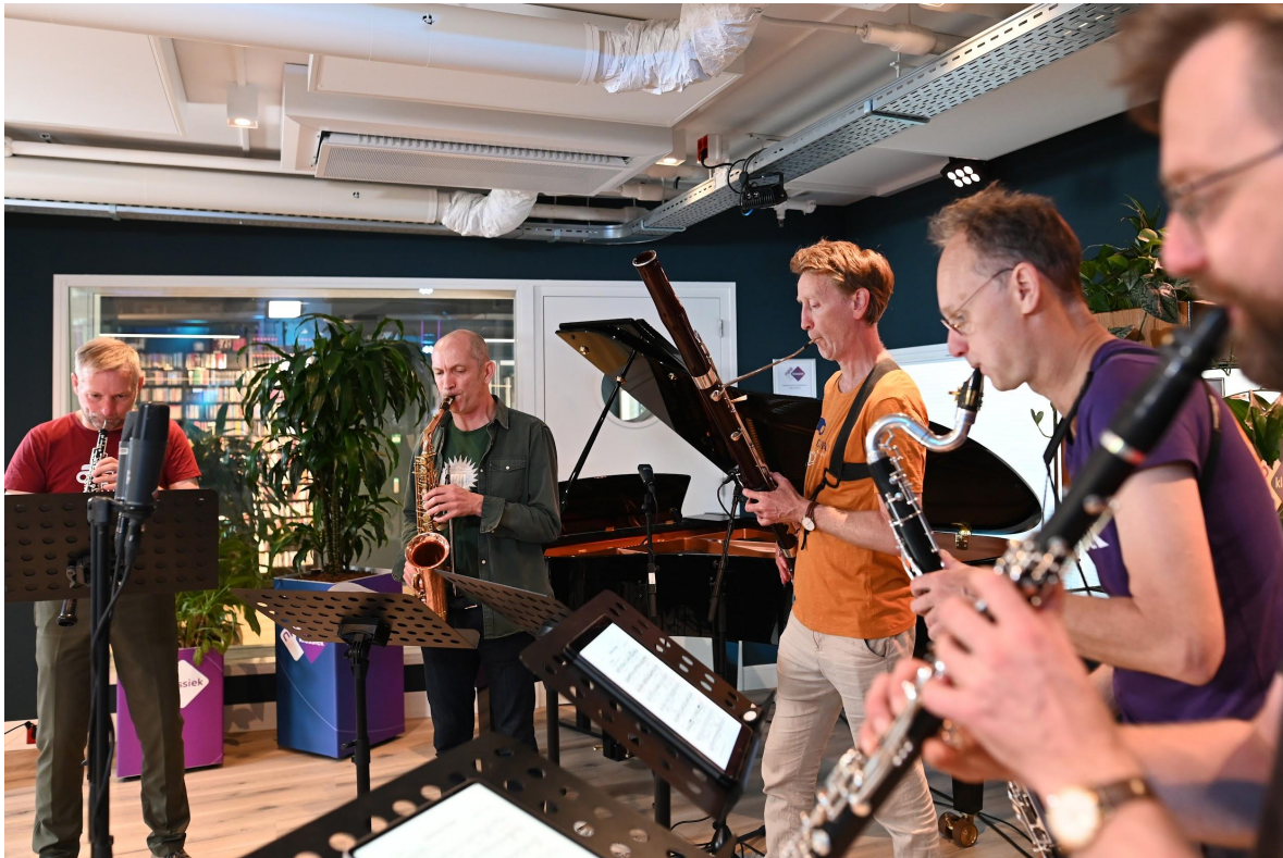
Calefax rietkwintet treedt live op bij NPO Klassiek met nieuwe composities van Nederlandse componisten

New Music NOW werkt in 2023 aan videoproducties met werk van onder anderen Vanessa Lann, Robert-Jan Stips, Rieteke Hölscher, Bram Kortekaas, Saskia Venegas, Bart Spaan en Danny de Graan.