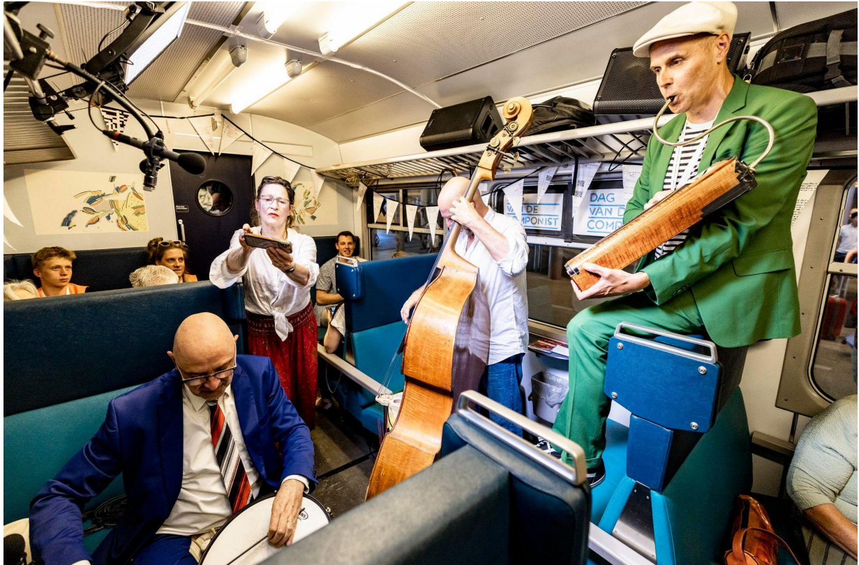
Martin Fondse, Componist des Vaderlands in de New Music NOW Expres

De New Music NOW Express bezocht 6 steden en had 5 trajecten met concerten in de trein. Publiek kon mee op muzikale reis met toonaangevende componisten en musici. Het geven van concerten in de trein bleek een uitdagend nog niet eerder vertoond avontuur. Voor het publiek was het een onvergetelijke ervaring om samen met de componisten in een kleine coupé bovenop de muziek te zitten, terwijl het landschap voorbijtrok. In de trein waren optredens te beluisteren van de slagwerkers Brendan Faegre en Konstantyn Napolov, van Asko|Schönberg, Kate Moore, Herz Ensemble, Calefax, Sanne Rambags, Marion von Tilzer, Vincent van Amsterdam, Tosca Opdam, Bianca Holst en van de Martin Fondse Band, die als huisensemble de hele dag met de trein meereisde. De componist/slagwerker Brendan Faegre bespeelde het meubilair in de trein als slagwerk.