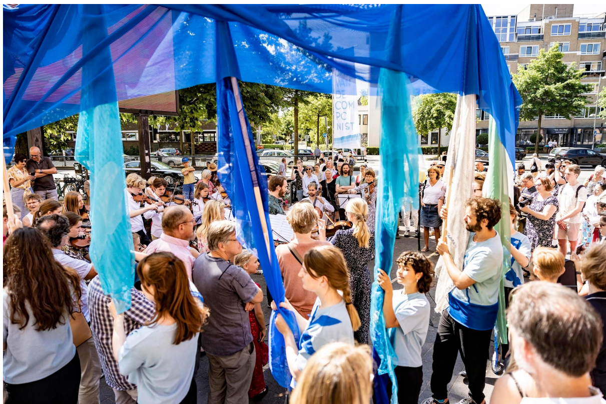
Encscenering rondom het Stadslied door studenten van RE:Master Opera op station Amersfoort Centraal